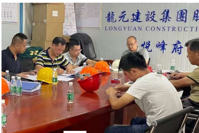
新会区住房城乡建设局检查“悦峰府项目 S1、地下车库悦峰府项目 1—4 号楼项目”

新会区住房城乡建设局对“悦峰府项目 S1、地下车库悦峰府项目 1-4 号楼项目”开展“两场联动”检查。检查发现：1. 未办理施工员、专职质量检验员和资料员变更手续；2. 未办理塔吊使用登机牌，未设置塔