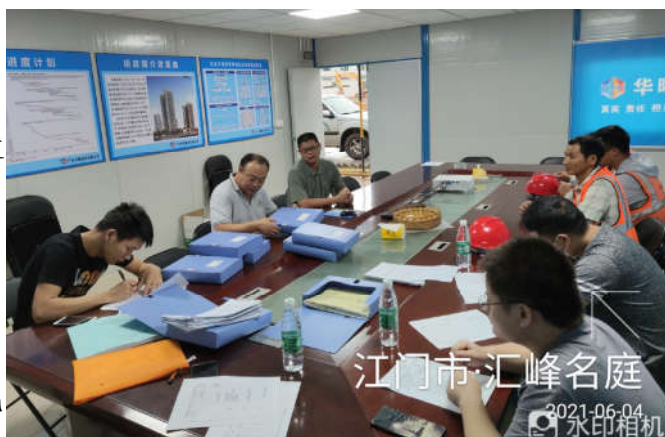
开平市住房城乡建设局检查“汇峰名庭 9#、12#住宅项目”

开平市住房城乡建设局对“汇峰名庭 9#、12#住宅项目”开展“两场联动”检查。检查发现：1. 施工现场未按规定设置安全警示标志；2. 灭火器配备不足。目前，检查发现的问题已完成整改。