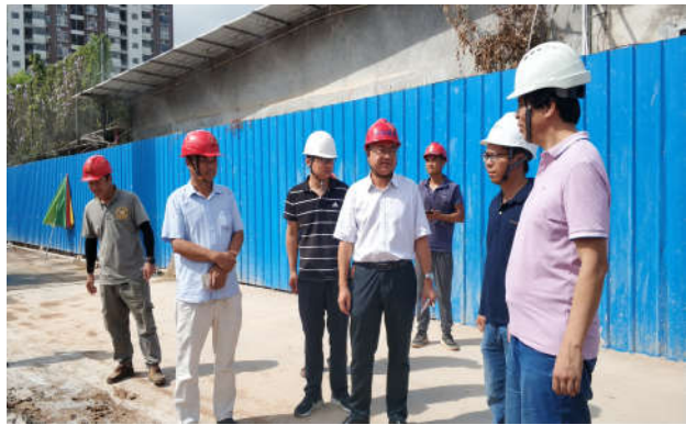
江门市住房城乡建设局检查“江门市妇幼保健院儿童健康大楼项目”