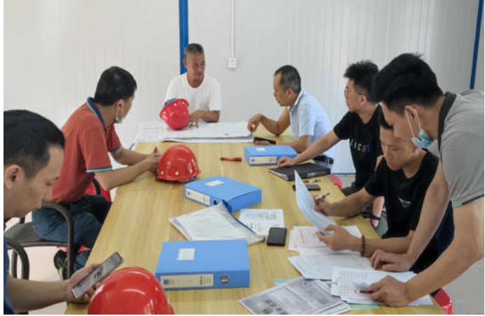
鹤山市住房和城乡建设局检查“鹤山市应急指挥中心项目”

鹤山市住房和城乡建设局对“鹤山市应急指挥中心项目”开展“两场联动”检查。检查发现：1. 未提供管理人员的工资流水、社保证明和合同；2. 未提供工人工资相关资料。目前，检查发现的问题已落实整改。