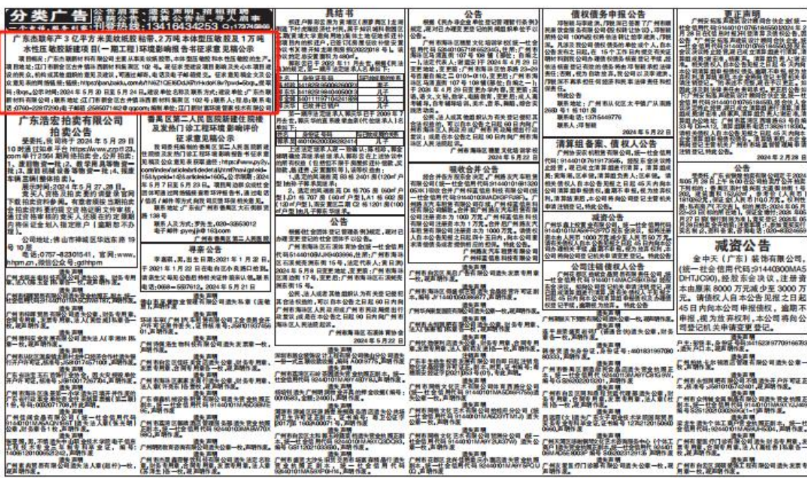
图 3-2(2)第二次环保公示报纸公示（2024年5月22日） 3.2.3 张贴