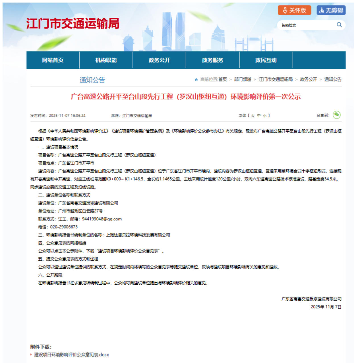
图 2.2-1 首次环境影响评价信息公示截图