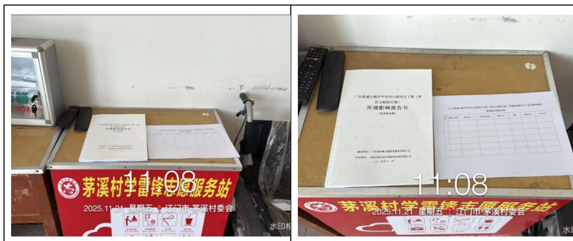
图 3.3-1 纸质报告设置场所情况