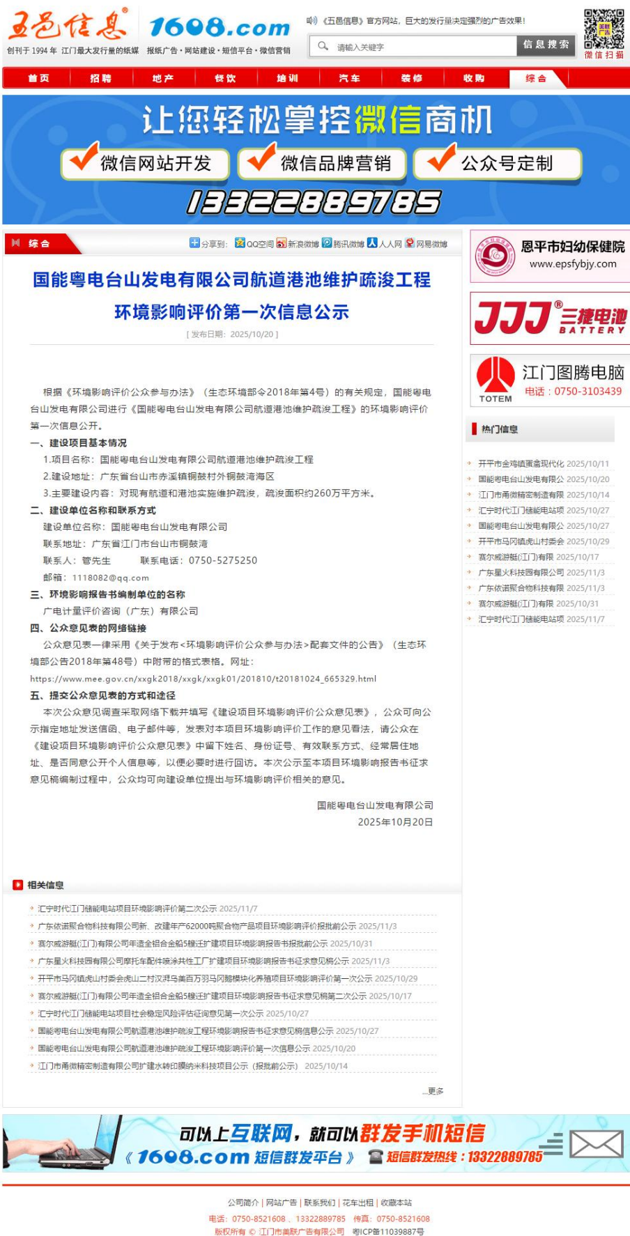
图 2-1 首次环境影响评价信息网络平台公示截图