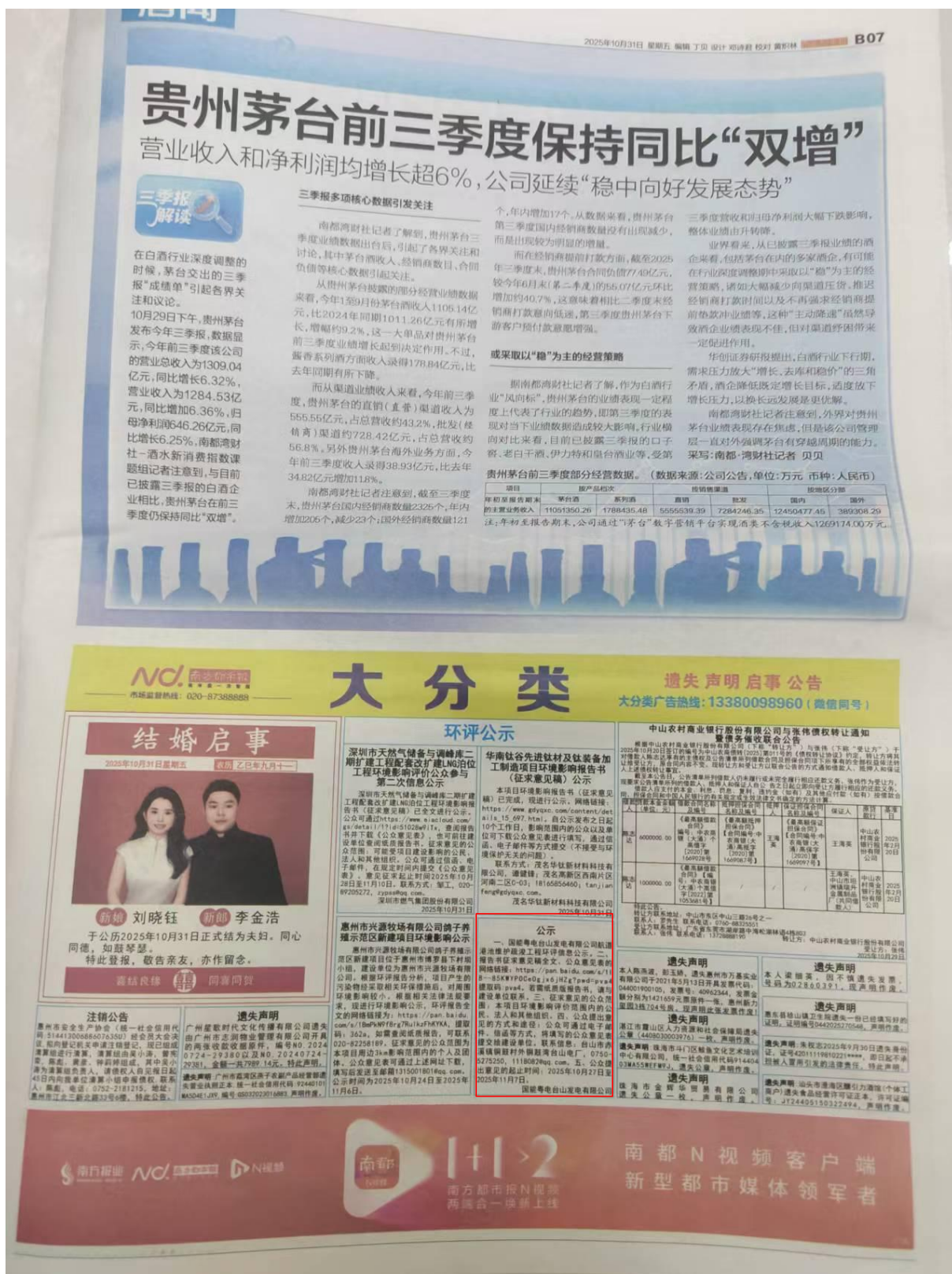
图 3-3 征求意见稿报纸公示截图（第二次登报：10 月 31 日）