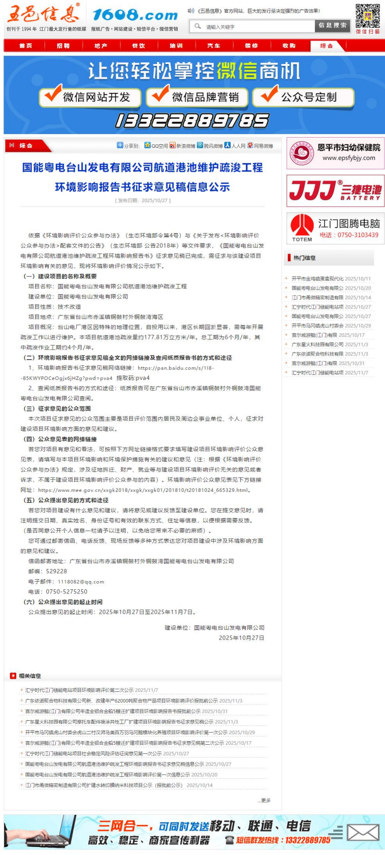
图 3-1 征求意见稿网络平台公示截图