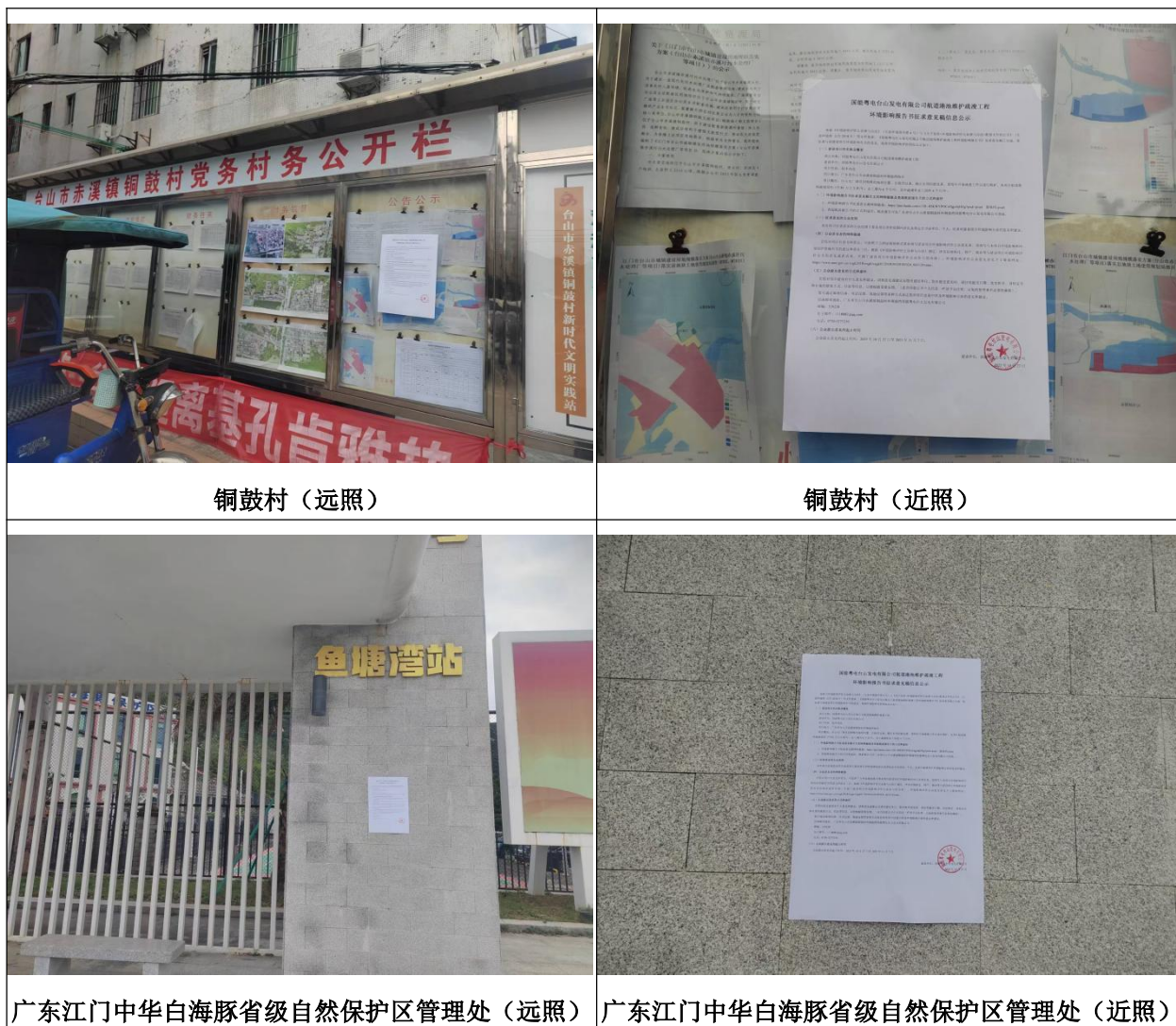
图 3-4 征求意见稿现场公示照片