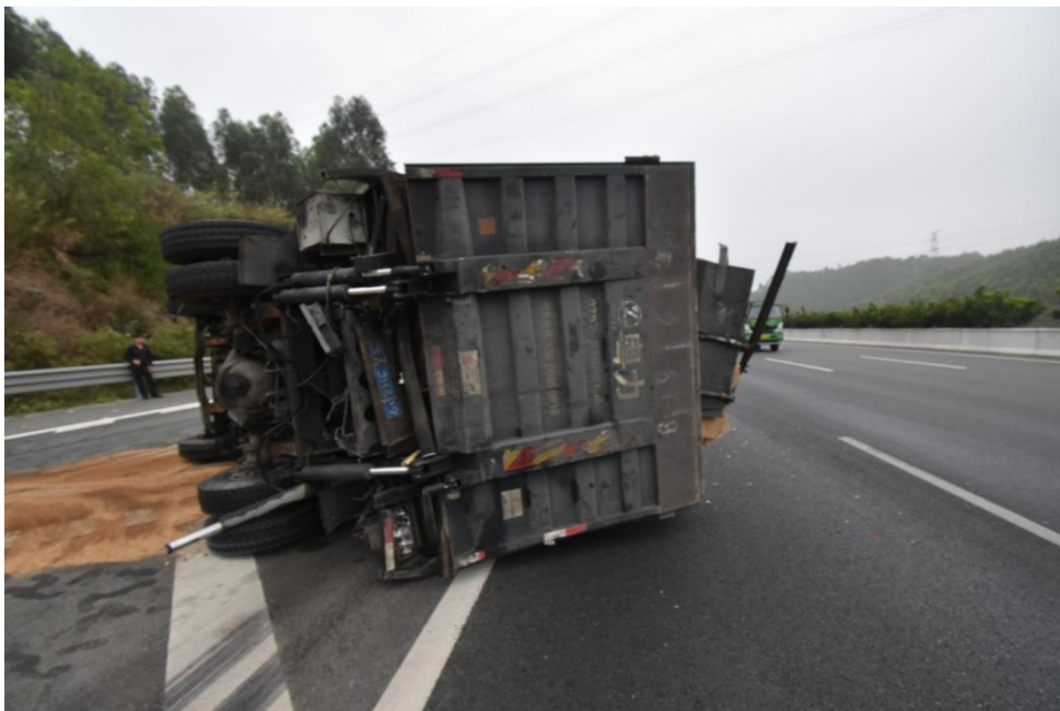
图 4 粤 A2H6P9 轻型厢式货车事故现场图