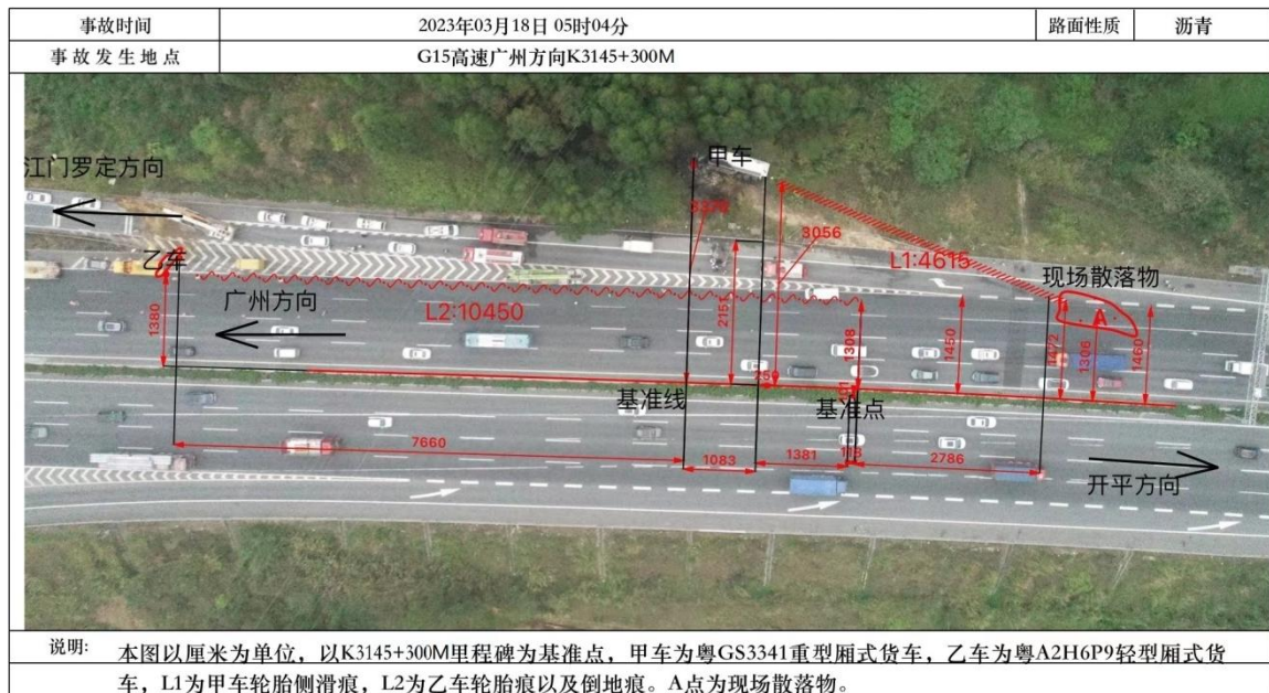
图 2 事故现场俯瞰图