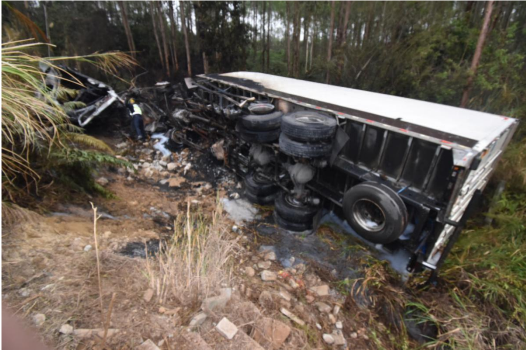
图 3 粤 GS3341 重型厢式货车事故现场图