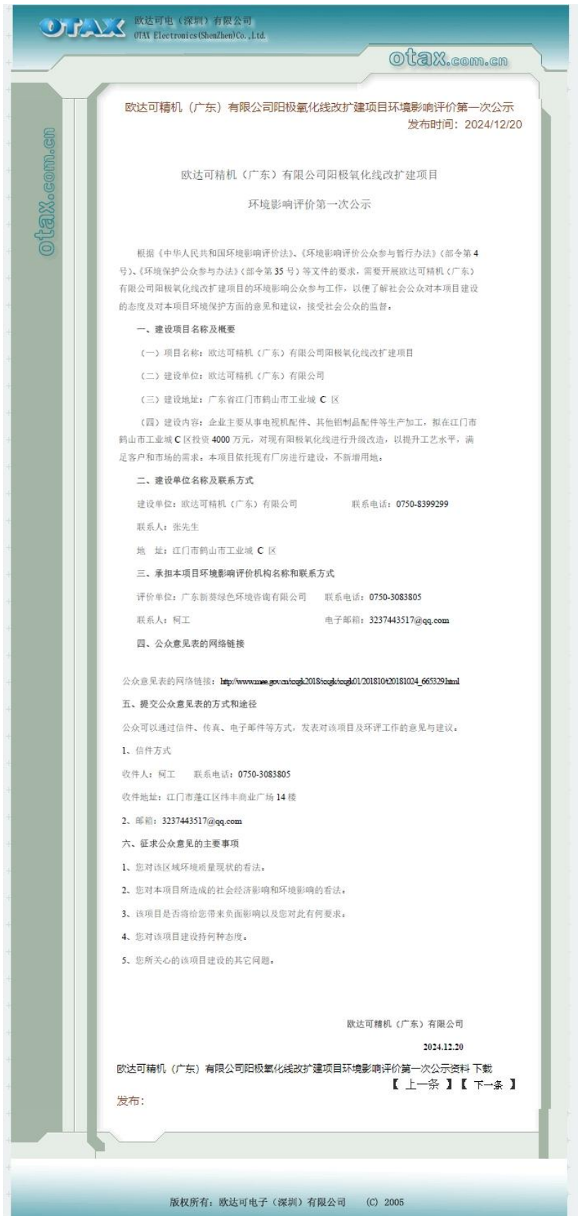
图 2-2 第一次环保公示网络截图