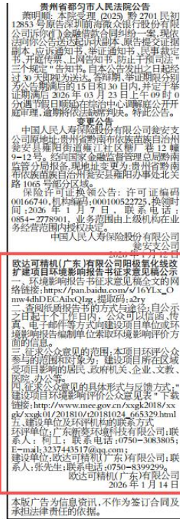
图 3-2 (1) 第二次环保公示报纸公示 (2026 年 1 月 14 日)

针对台积电进一步到美国设厂，“台湾经济研究院”产经数据库总监刘佩真表示，若要在一个地区运作5至8座晶圆厂，无论是电力供应、水资源回收体系，还是最关键的工程师人才招募，对台积电而言都是重大的挑战，“虽然极大化满足地缘政治风险，但会成为台积电财务获利的考验”。刘佩真提及，整体考虑投资回收期，台积电不太可能将获利较薄弱的成熟制程移往美国，未来在美国新增的每一座设施，预计都将以人工智能时代最尖端的制程与设计为主，“那就不仅是技术的转移，更是全球半导体最精锐产能开始大规模往美国移动，对台积电及全球半导体版图将带来长远影响”。▲