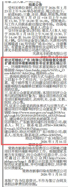
图 3-2 (1) 第二次环保公示报纸公示 (2026 年 1 月 16 日)

美国入侵格林纳达引起国际社会的强烈谴责，英国、加拿大等国谴责美国悍然入侵一个主权国家，联合国大会以108票赞成、9票反对、27票弃权的结果通过一项决议，谴责美国“公然违反国际法”。美军入侵格林纳达期间，美国国内也爆发大规模反战游行，在首都华盛顿，反战游行超过5万人参加，游行队伍中不乏市长等要员。▲