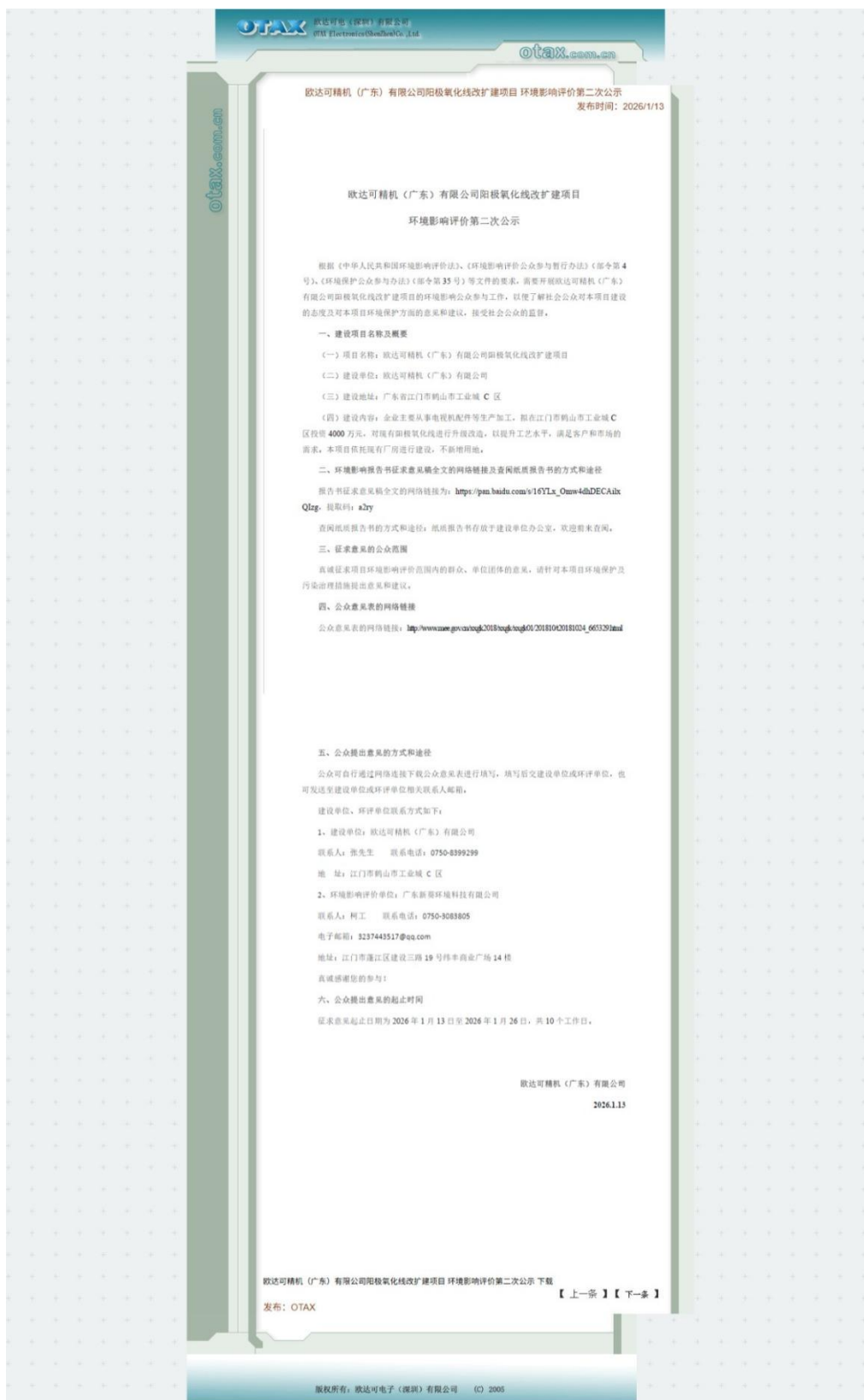
图 3-1 第二次环保公示网络截图