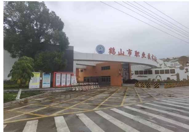
鹤山市职业技术学校（远）