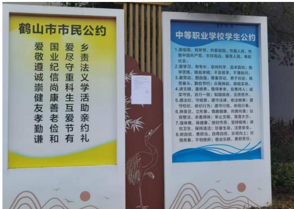
鹤山市职业技术学校（近）