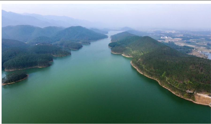
(宝鸭仔水库实景图)