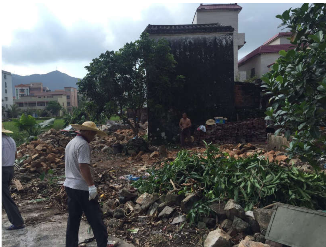
▲川岛镇沙田村清拆前

通过这一次“三清三拆三整治”工作，略尾村、沙田村人居环境长久以来“脏、乱、差”的局面被完全扭转；过去杂草丛生的房前屋后、杂物乱放的巷道、淤积发臭的沟渠目前已分别变成宽阔平整的空地、明亮整洁村道、畅通的水渠。群众对略尾开展“三清三拆三整治”工作都赞不绝口，对川岛镇政府、略尾社区下一步工作都充满了信心。