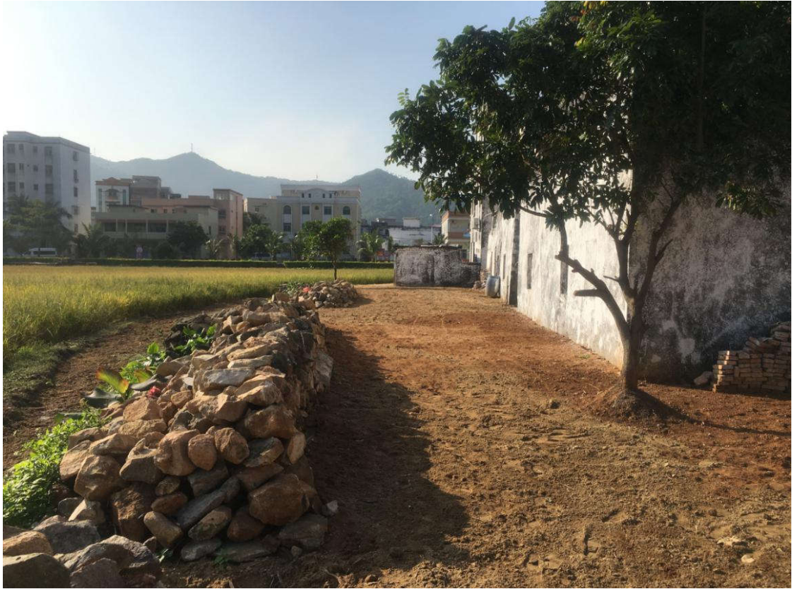
▲川岛镇沙田村清拆后