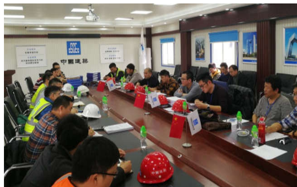
蓬江区住建局检查滨江 52 号地块项目

2 月 27 日，蓬江区住建局对“滨江 52 号地块项目”开展“两场联动”检查。2 月份蓬江区住建局共检查项目 94 个，发现质量安全隐患 63 项，发出整改通知书 8 份，主要质量安全隐患为消防管理落实不到位、部分项目安全员未认真履职、部分监理企业总监理工程师不到位等。蓬江区住建局要求施工企业、监理企业确保人员到岗履职，认真落实问题整改。