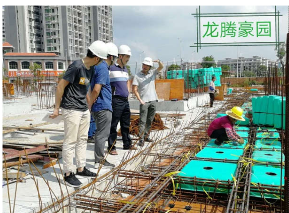
台山市住建局检查龙腾豪园项目

台山市住建局对“龙腾豪园项目”开展“两场联动”检查。2 月份共检查项目 15 个，发现质量安全隐患 104 项，发出整改通知书 15 份，主要质量安全隐患为未有效落实施工扬尘防治措施、临边防护措施不到位、检查时项目经理、专职安全员未到岗履职等。台山市住建局要求施工单位定人、定时、定措施进行整改，确保消除每项隐患。