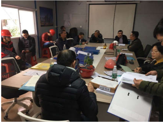
鹤山市住建局检查时代翠峰花园 1 标项目

城力净智能洗涤设备厂区工程项目”开展“两场联动”检查，重点查处项目违法分包、转包挂靠、任意压缩合理工期、降低工程质量安全标准等违法违规行为。2 月份鹤山市住建局共检查项目 7 个，发现质量安全隐患 27 项，发